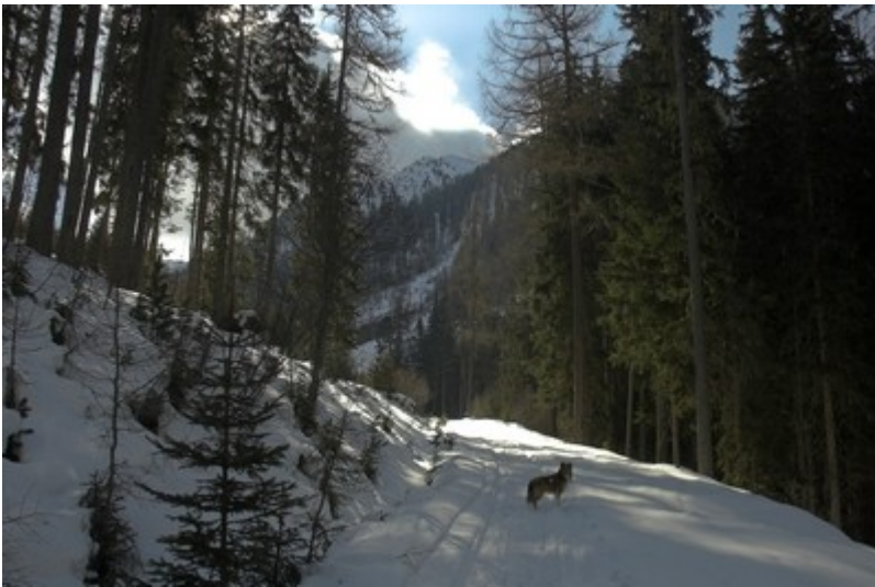
Aufstiegsweg zur Mittenberger Alm