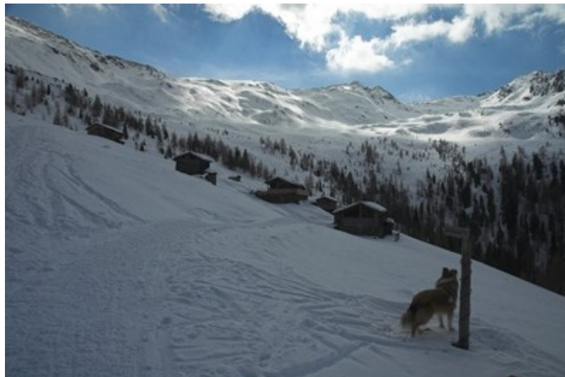
Das Ziel erreicht die Mittenberger Alm von hier aus kann man weiter zum Speikboden wandern.